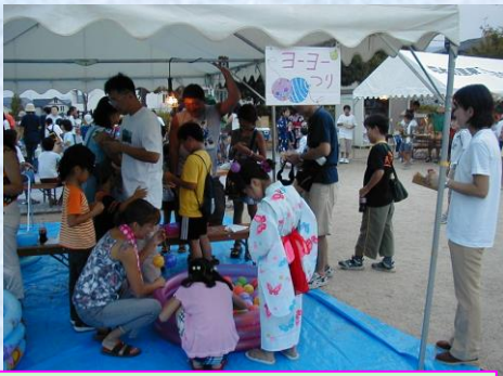
なつまつり ヨーヨー釣り 「つれたつれた」