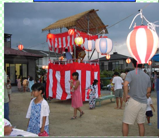
夏の宵は盆踊りがよく似合う