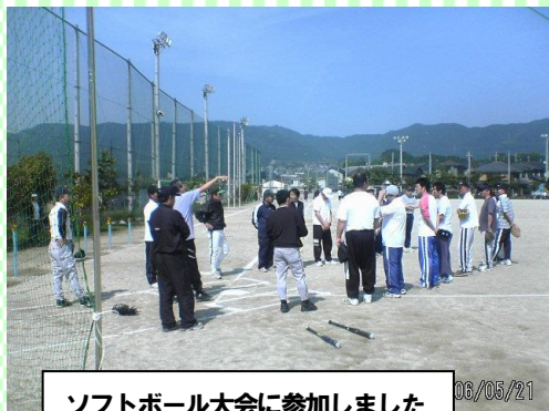
ソフトボール大会に参加しました 06/05/21