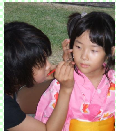
夏祭り 成安造形大学の学生さんにフェイスペイティングしてもらおう子ども達