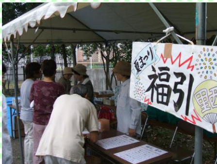
夏祭り 何が当たるか楽しみ!

里西自治会は仰木の里2丁目に位置し、平成3年4月に発足しました。町内の北側に古墳公園(通称たけやぶ公園)があり、開発当時、この地に点在していたお地蔵さんをこの公園の一画にあつめてお祀りしています。毎年夏祭りに、会員が作った前掛けを付け替え、古い分は仰木小椋神社に奉納します。里西自治会は新しい自治会ですが、古い文化も大切にします。