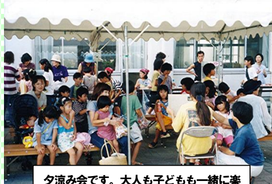
夕涼み会です。大人も子どもも一緒に楽 しんでいます

学校前自治会は仰木の里四丁目で見 小学校の南西に位置します。世代層 は若い世代から熟年の世代まで幅広 く、スポーツマンあり、文化人あり、 といった色々なジャンルにわたる 様々な人々が普段の生活をしている 素晴らしい自治会です。