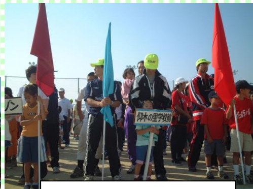
市民運動会の開会です。今日はいい 天気だ。最高。ガンバルゾー