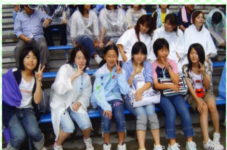
中Pこども会のレクリエーション(USJにて)