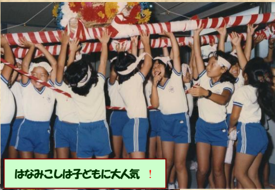
はなみこしは子どもに大人気！