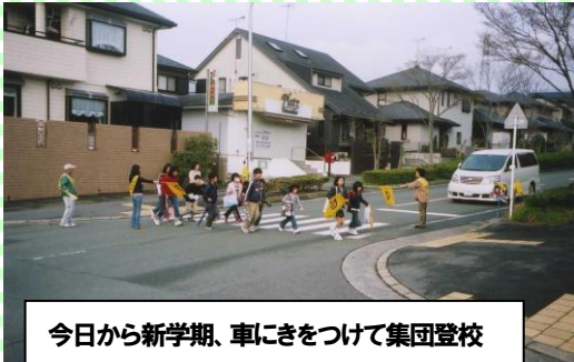
今日から新学期、車にきをつけて集団登校