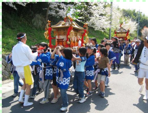
春だ! まつりだ! わっしょい! ワッショイ!