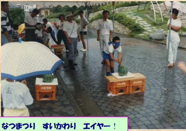
なつまつり すいかわり エイヤー！