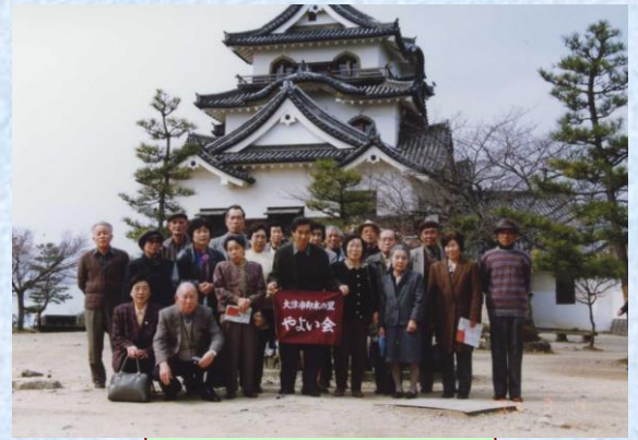
老人クラブやよい会の活動

中央自治会は仰木の里6丁目、仰木の里市民センターの西側真向かいに位置します。発足は古く平成元年で、今年で18年になります。その分だけ高齢化が進み、知識の宝庫？と言われていています。住民の防災意識が高く、消火栓送水訓練等も行っています。夏には3町(東山、中央、里北)合同で恒例の夏祭りを行い、親睦を深めています。老人クラブ「やよい会」も活発に活動しています。その一部を紹介します。