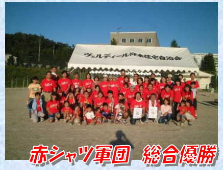
赤シャツ軍団 総合優勝