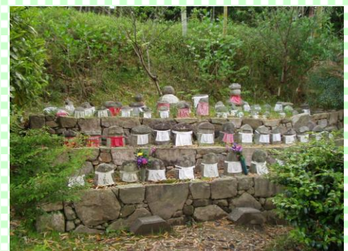
古墳公園 (通称:たけやぶ公園)