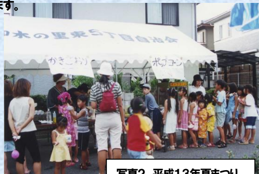
写真2 平成13年夏まつり