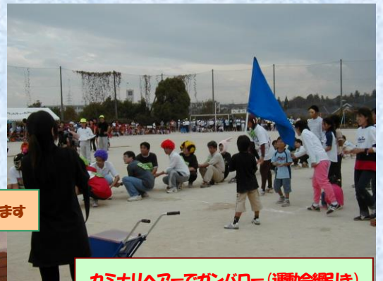
カミナリヘアでガンパロー(運動会綱引き)