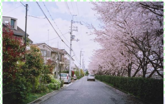
桜通り。大きく成長しました