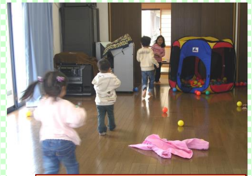
きらきらクラブ(子育て支援事業)の活動

仰木台自治会は仰木の里東8丁目に位置し、町内の歴史は古く30数年になります。平成11年度に建設した自治会館は様々な形で利用され、活動の中心となっています。仰木台には子供会、鳩の会、氏子会、きらきらくらぶなどが活躍しています。そのいくつかを紹介しましょう。