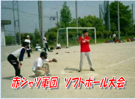
赤シャツ軍団 ソフトボール大会