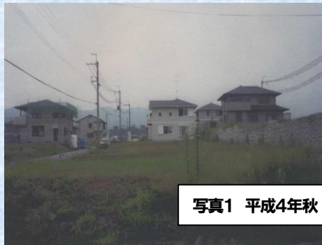
写真1 平成4年秋 西側遠望

仰木の里東5丁目は、当初仰木の里C地区と呼ばれる地区の一画として開発が始まっており、湖西道路を挟んで仰木地区の中心、レークピアセンターに近い位置にあり、仰木の里東地区では一番早く開発が始まった中心的な地域です。仰木の里東5丁目自治会は当初仰木の里C地区第1自治会と称しこの地域では最初に活動を始めました。本格的な自治会活動は平成4年10月に自治会発足の届け出を大津市へ出して始まっており、当時仰木の里C地区の他地域には住宅がなく、C地区第1自治会にしても世帯数はたった11世帯で、むこう三軒両隣に近い非常に小さなものでした