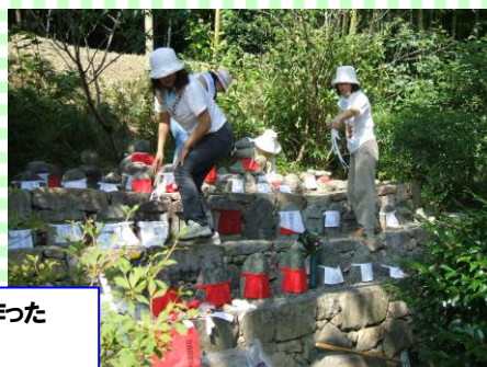
毎年夏祭りの当日、会員が作った前掛けを付け替えます。