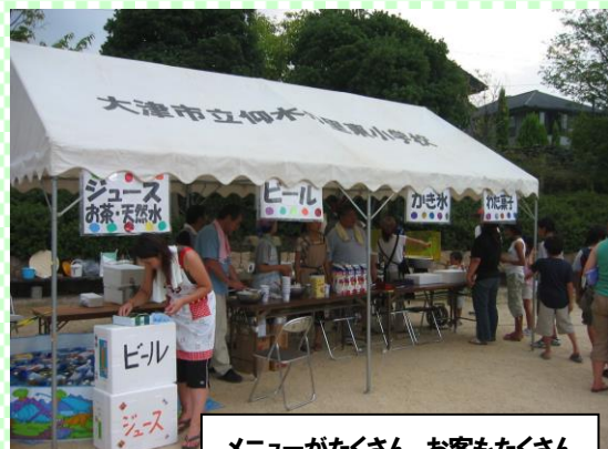
メニューがたくさん、お客もたくさん