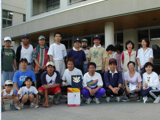
H13 ソフトボール大会 準優勝しました