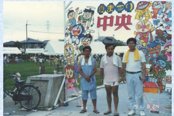
3町合同夏まつり 中央ゾーン!