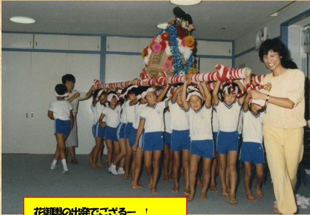
花御輿の出発でござるー！

里自治会は仰木の里1丁目に位置し、仰木の里の居住では最初の地域です。今年で自治会創立20周年を迎え、20周年記念夏祭りを開催しました。