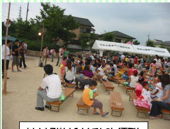
おとなも子どももみんなてたのしく夏祭り