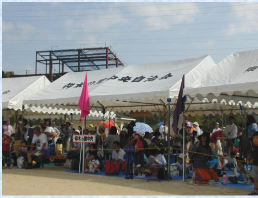
はでなこの旗は我が中央自治会のカラーです

中央自治会は仰木の里6丁目、仰木の里市民センターの西側真向かいに位置します。発足は古く平成元年で、今年で18年になります。その分だけ高齢化が進み、知識の宝庫？と言われていています。住民の防災意識が高く、消火栓送水訓練等も行っています。夏には3町(東山、中央、里北)合同で恒例の夏祭りを行い、親睦を深めています。老人クラブ「やよい会」も活発に活動しています。その一部を紹介します。