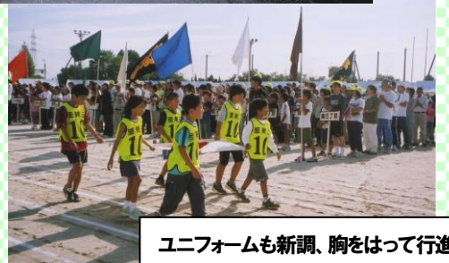
ユニフォームも新調、胸をはって行進