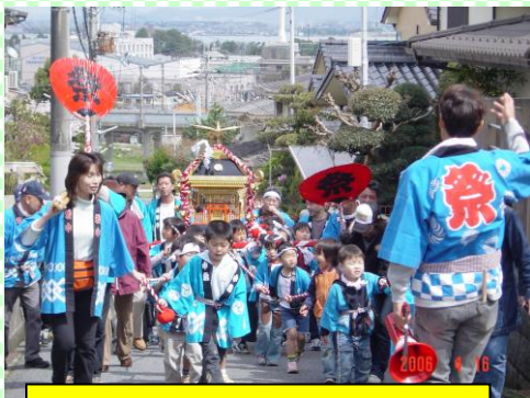
春祭り おとも子どもも ワーツショイ