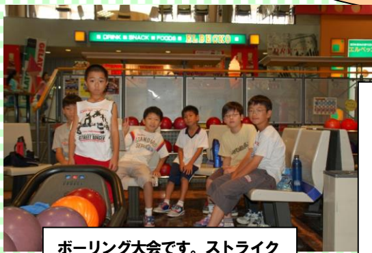
ボーリング大会です。ストライク