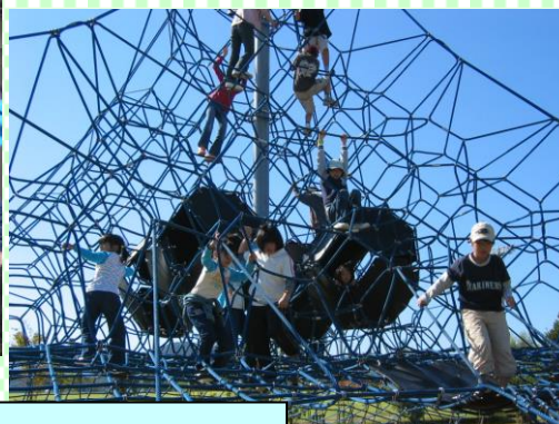
こんがらがって大変 子供会