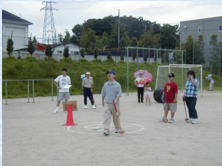
軽スポーツ大会 グランドゴルフに参加して