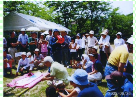
自主防災訓練 我が町は我が手で

昭和51年頃に販売を開始された団地「衣川台」(当時光陽が丘)に52年から入居が始まりました。54年に堅田学区衣川自治会に加入、55年に独立して堅田学区衣川台自治会として発足しました。その後、平成8年に仰木の里東小学校へ小学校区が変更され、自治会は平成15年に仰木の里学区に16番目の自治会として加入しました。発足当時は40戸程でしたが現在では340戸を超える大きな自治会になっています。