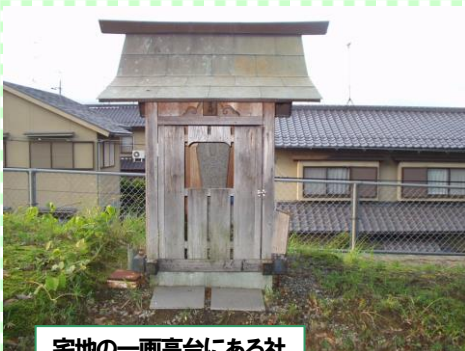
宅地の一画高台にある社