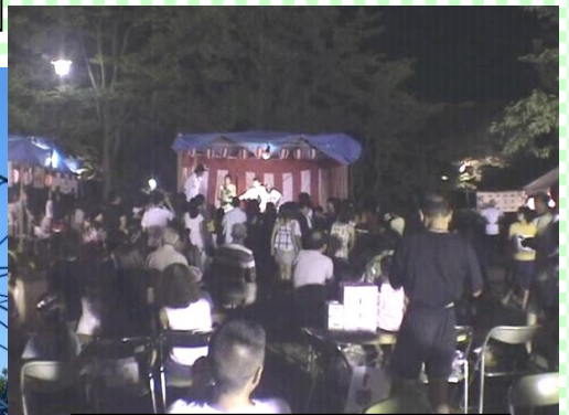
なつ祭り 今宵演芸のひとときを