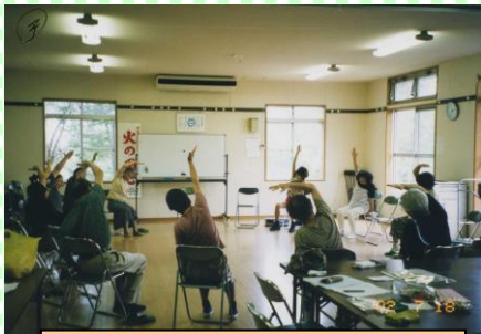
ボランティアグループ「オアシス」の高齢者対象エアロビック体操