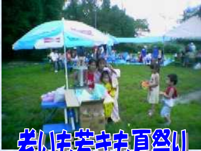
老いも若きも夏祭り