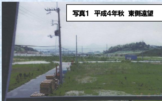
写真1 平成4年秋 東側遠望

250余の世帯数を擁する現在の仰木の里東5丁目の状況からは当時の状況(写真1 平成4年秋、地域内中心より西を望む)を想像することが難しくなっています。その後さらに地域内の環境整備、ユーティリティの充実が進むとともに、よい住環境を求めて転入者が増加し、それに伴い周辺の自治会と連携して歩みを進めることが重要と考え平成9年には仰木の里学区自治連合会に参加しました。住民の増加とともに児童数も増え平成13年には地域内の子供を対象に有志による夏祭り(写真2)が行われるまでになりました。現在は地域内の空き地もわずかとなり住宅戸数ほぼ満ち、緑も十分な歳月を経て豊かな落ち着いた風情を呈しています。