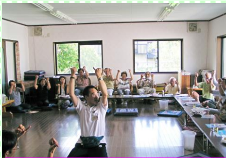
今日も頑張ってる鳩の会(老人クラブ)元気サロン